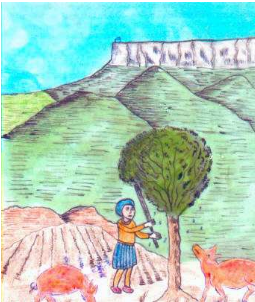
Pagès fent caure els aglans, per que mengin els seus porcs.

El rei Ferran II que llavors governava, es va donar compte que les armes no resoldrien aquell