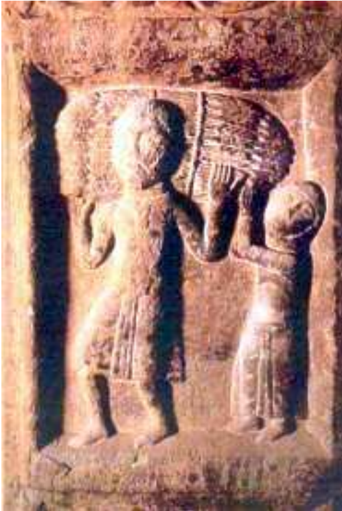
Pagès i pagesa treballant al camp. Portalada de Ripoll, segle XI.

Vers l'any 1000 els pagesos catalans son lliures i protegits per la Cort Judicial del Comte de Barcelona.