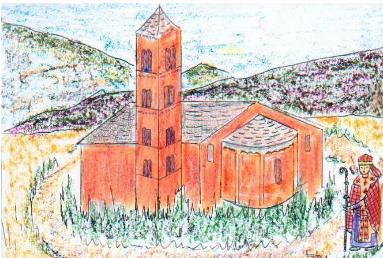
La formació de la Sagrera. Recinte sagrat al voltant de l'església parroquial.

Durant els tres primers segles, tingueren tot en contra: el Rei, les Corts, la noblesa, l'alta burgesia i també l'església, que posseïa un gran nombre de masos remences. Aïllats en els seus masos i indefensos, depenien completament del seu senyor.