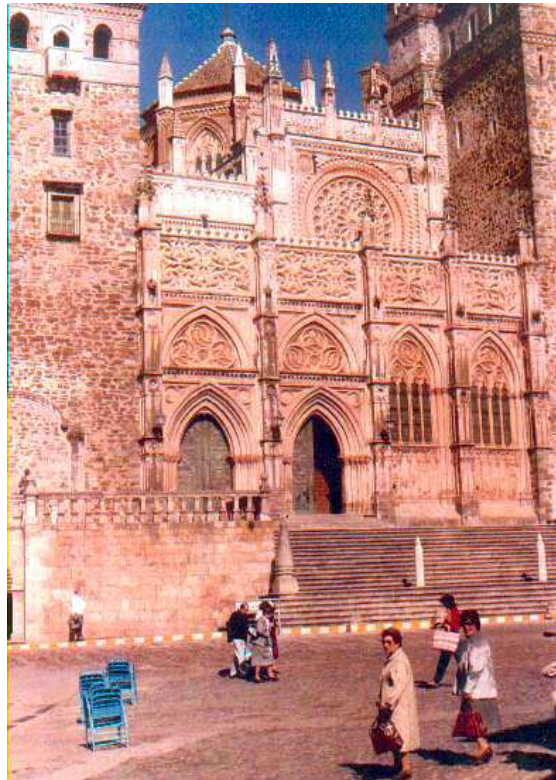
Monestir de Guadalupe (Extremadura), on el rei Ferran II va dictar la famosa sentència arbitral

La situació del remences s'havia convertit en molt difícil, però encara quedaven els castells de la Muntanya, que dirigits i governats per Verntallat s'oposaren a oblidar les seves reivindicacions i volien que s'abolissin els mals usos i així convertir-se en homes i dones lliures.