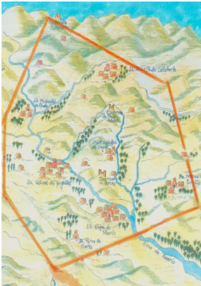
Àmbit de la senyoria feudal: Set parròquies i tres castells

S'implanten els mals usos de la intestia, exorquia i cugucia, àrsia i firma d'espoli, i el més greu de tots, el de la redempció personal , que devia pagar el pagès al senyor si vol abandonar el mas.