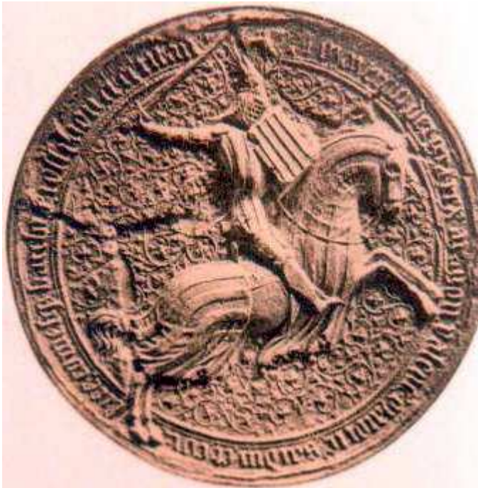
Segell del rei Martí l'humà (1396-1410)

El segle XIV començà malament, grans dificultats originaren ja a l'any 1333 fos conegut com "lo mal any primer". Fams, caresties, pèrdua de collites , prediran la gran catàstrofe de 1348-1349. Una gran epidèmia de pesta negra assolà tot el sud d'Europa. La mortaldat en els masos fou enorme i es calcula que zones pobres de la Muntanya remença (Garrotxa, Ripollès) la pèrdua de masos abandonats per la mort dels seus habitants fou grandíssima, sobretot afectà els masos més petits, que eren molts abans de la pesta i en quedaren molt pocs després.